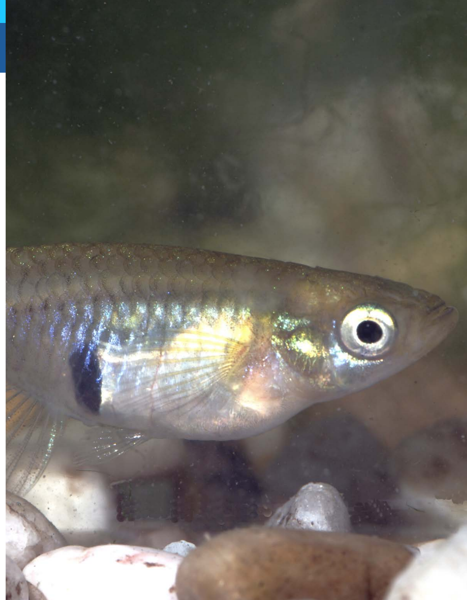
Gambusia ( Gambusia holbrooki ). C.González Revelles

7.6. Establecer comités de cogestión en las zonas invadidas por PEEI en las que existan actividades socioeconómicas asociadas, para alcanzar acuerdos con los grupos de interés. Por ejemplo, los pescadores profesionales deben participar en la gestión de los PEEI objetivo estableciendo compensaciones entre la explotación sostenible y las medidas específicas de contención.