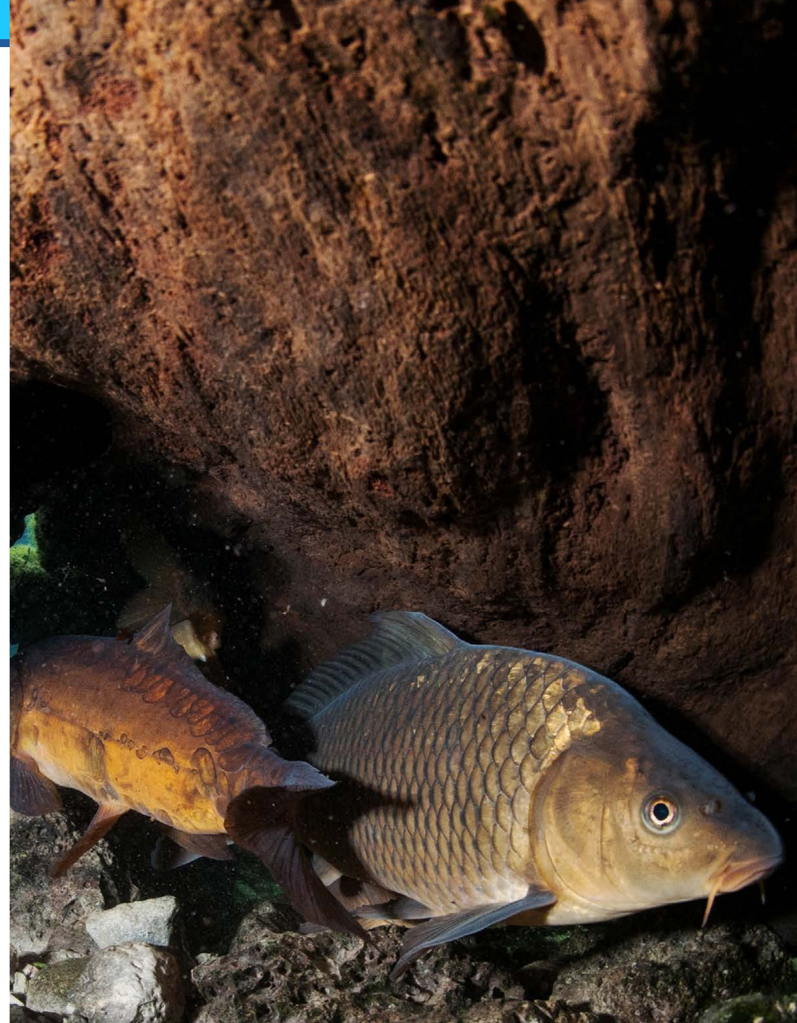
Carpa común ( Cyprinus carpio ).

Estrategias/programas transnacionales: Estrategias y programas hispano-portugueses desarrollados e implementados de forma coordinada.