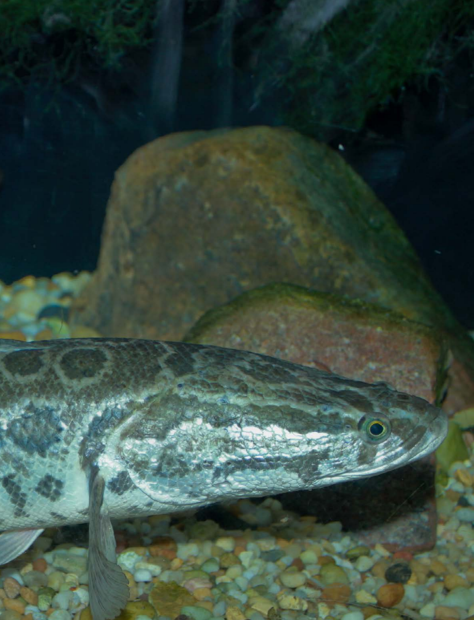
Pez cabeza de serpiente ( Channa argus )

Un objetivo importante de LIFE INVASAQUA es desarrollar herramientas que mejoren la gestión y aumenten la eficacia del marco de Alerta Temprana y Respuesta Rápida para Especies Exóticas Invasoras (EEI) en la Península Ibérica. En coordinación con la Sociedad Ibérica de Ictiología (SIBIC), desarrollamos un proceso participativo con expertos para obtener unas Recomendaciones Estratégicas para la gestión transnacional de peces exóticos invasores en aguas continentales de España y Portugal. Las recomendaciones promueven la gestión coordinada entre España y Portugal, con el fin de facilitar la aplicación de los compromisos internacionales y las mejores prácticas apoyando el desarrollo de políticas y objetivos en materia de gestión de peces invasores. Las recomendaciones fueron diseñadas para servir como una herramienta de orientación que busca identificar una dirección estratégica en la gobernanza que vienen desarrollando ambos países. Las Recomendaciones Estratégicas resultantes son importantes para la aplicación del Reglamento de la UE sobre EEI. En última instancia, la información incluida puede ser utilizada para alcanzar el objetivo de la Estrategia de la UE sobre Biodiversidad para 2030 para hacer frente a las EEI, y también para la aplicación de otras políticas de la UE con requisitos sobre especies exóticas, como las Directivas de Aves y Hábitats, y las Directivas Marco sobre la Estrategia Marina y Marco del Agua.