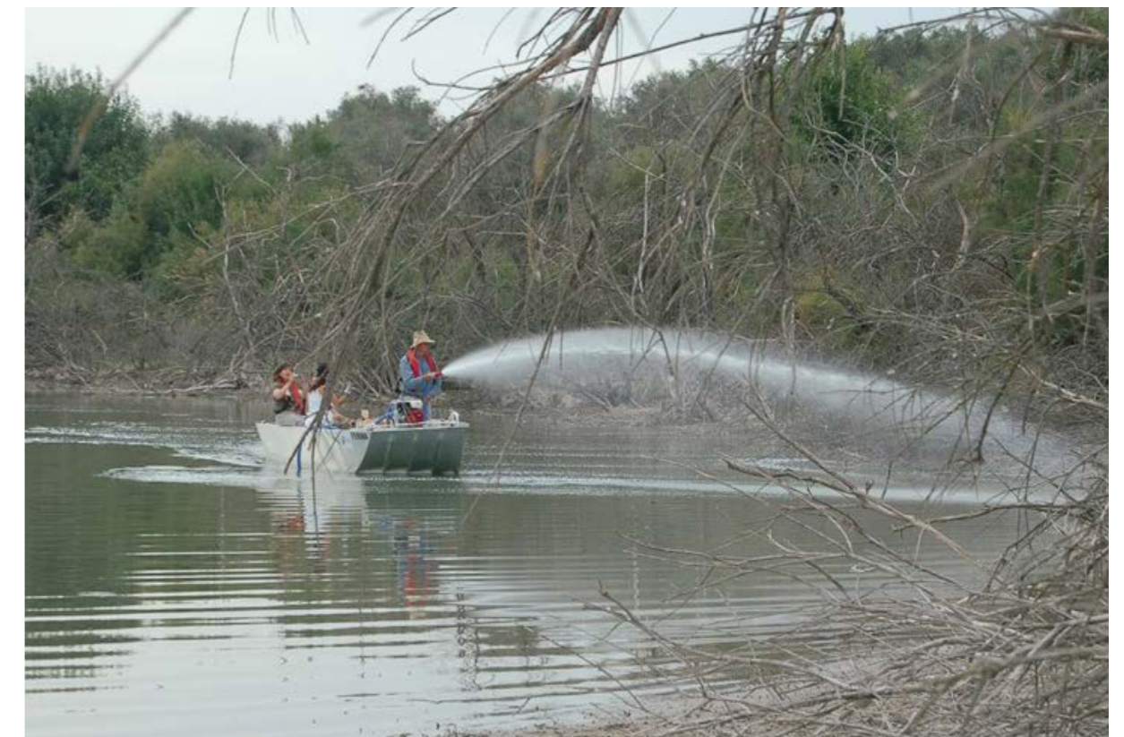
Programa de erradicación de carpas con rotenona en la laguna de Zoñar (Spain). C. Fernández-Delgado.