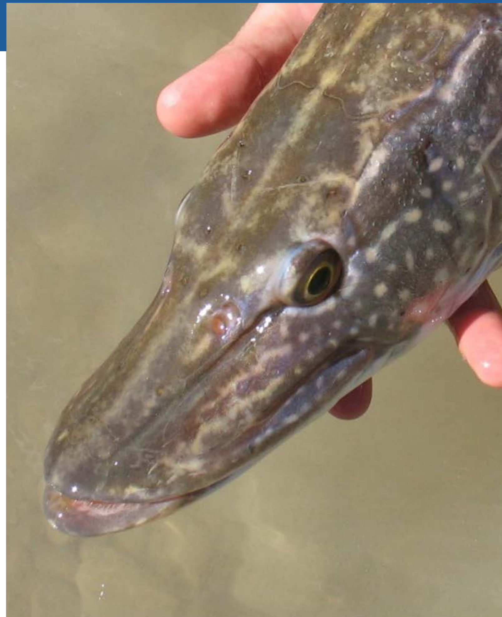
Lucio europeo ( Exos lucius ). F.J.Oliva SIBIC