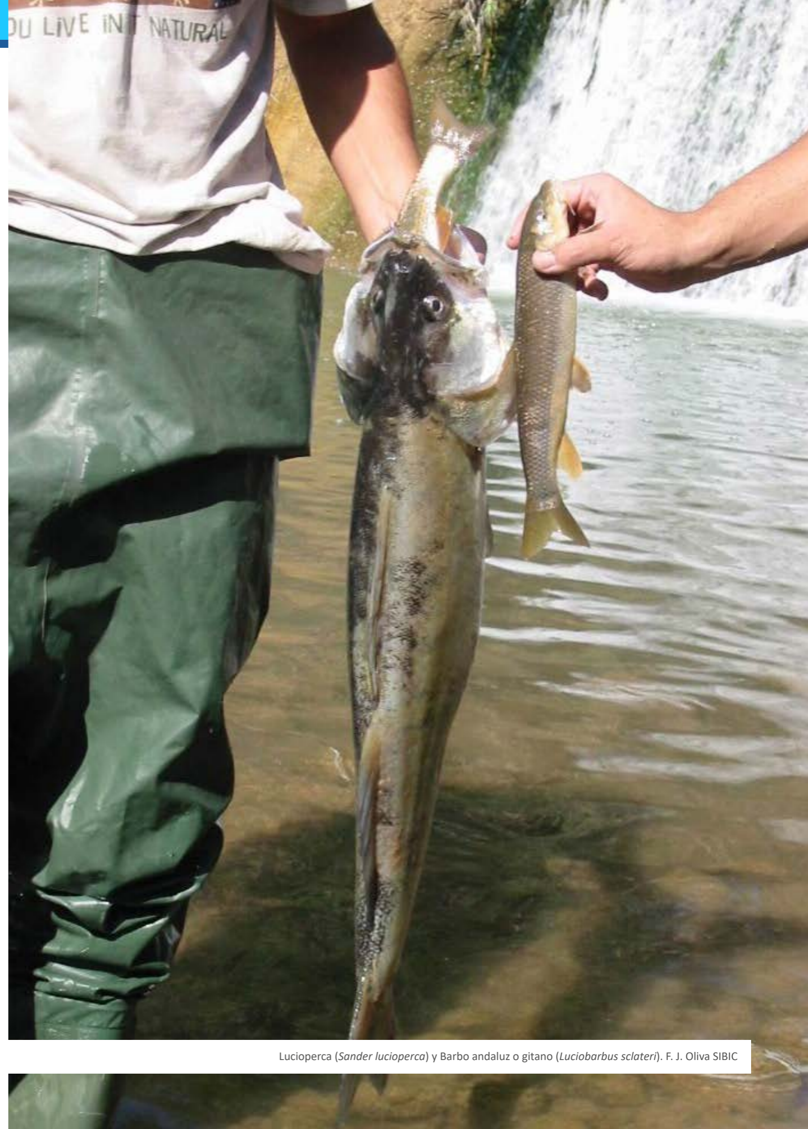
Lucioperca ( Sander lucioperca) y Barbo andaluz o gitano ( Luciobarbus sclateri).