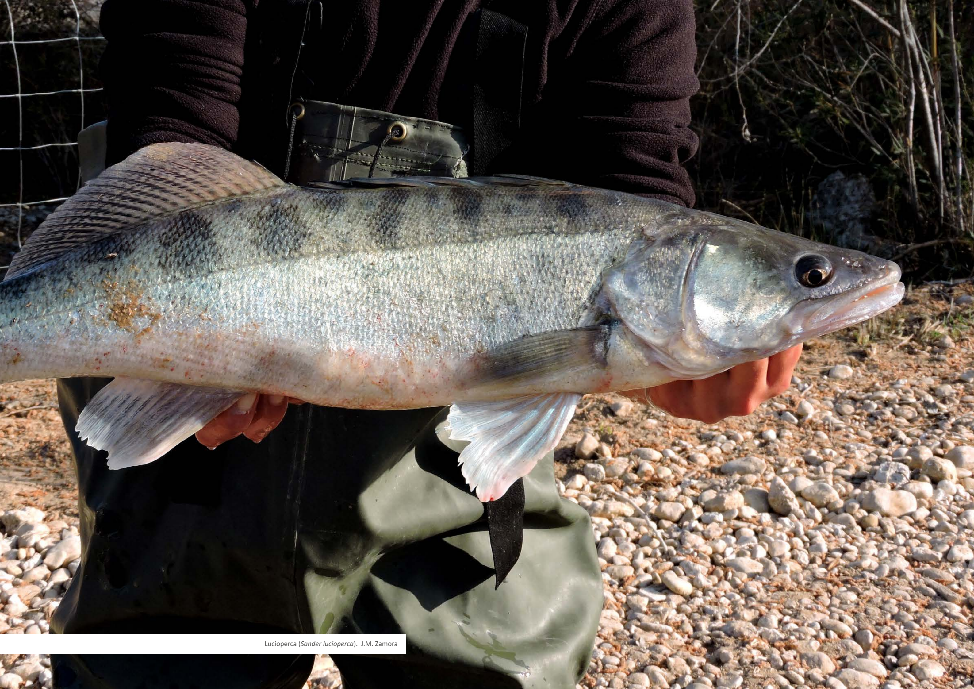
Lucioperca ( Sander lucioperca ). J.M. Zamora