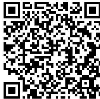
Ilustración 3. QR acceso Código de conducta comercio electrónico fauna y flora exótica invasora