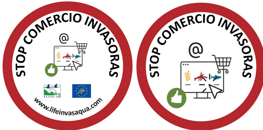
Ilustración 1 Logo campaña Stop Comercio Invasoras con y sin referencia a LifeInvasaqua

https://drive.google.com/drive/folders/1ScB1kWT8DFRDpGE1t2BC7F0B6V0jwUK?usp=sharing