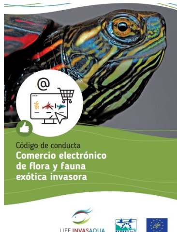
Ilustración 2. Código de conducta comercio electrónico de fauna y flora exótica invasora